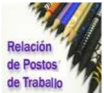
Relación de Postos de Trabajo

O prazo de presentación de solicitudes será de dez días naturais